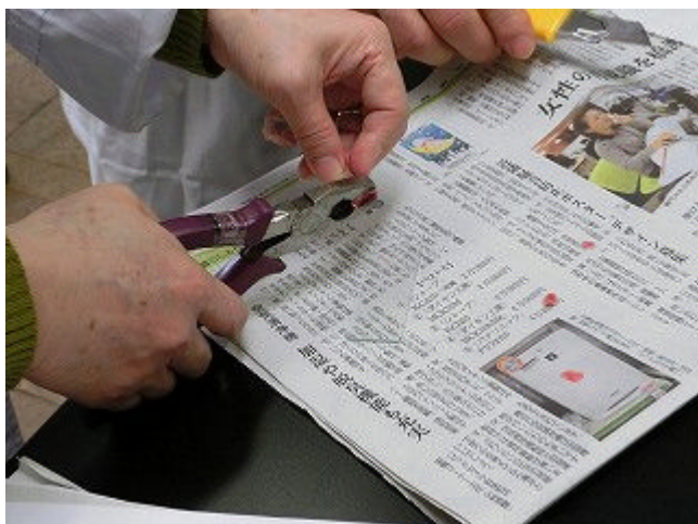
骨髄から髄液を押し出す様子