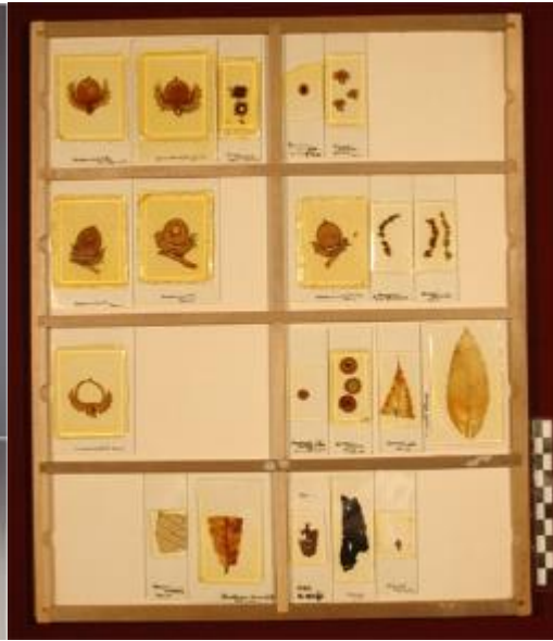
左図：オオミツバマツの球果化石