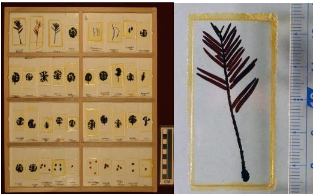
左図：プレパラート標本群 (2018年に大阪市指定天然記念物に指定)

実際に三木博士が採集、研究したメタセコイア化石標本を展示し、三木博士がどのような考えでメタセコイアの発見に至ったのか、分かりやすく解説します。