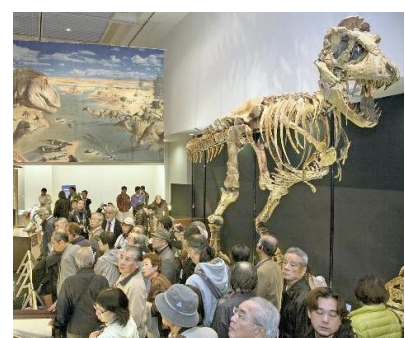
モンゴル恐竜化石展の会場風景

◎大相撲大阪場所 日本相撲協会大阪先発事務所（電話06-6631-0120） 公式ホームページ http://www.sumo.or.jp/