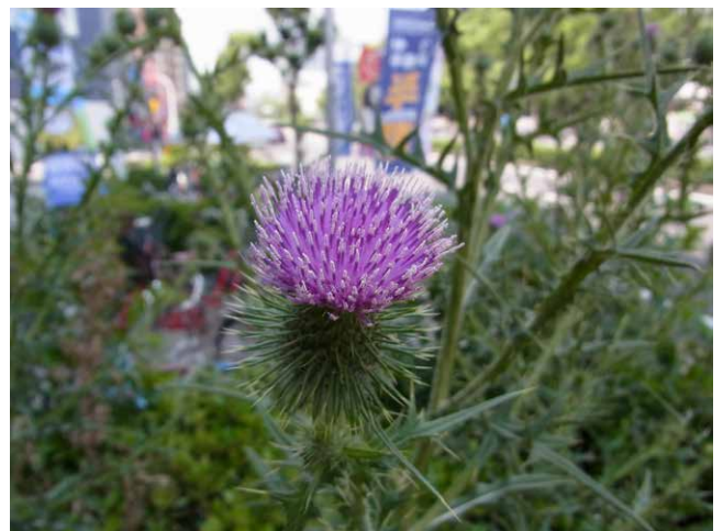
④＜アメリカオニアザミ＞

在来のオンブバッタとそっくりですが、後ばねは濃い赤色です。2008年に大阪の沿岸部で見つかりましたが、今では近畿地方の平野部に広く分布しています。