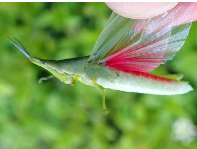
③＜アカハネオンブバッタ＞

北米原産の外来魚で、1916年頃、ボウフラ駆除のために日本に持ち込まれました。メダカ類とよく間違われますが、メダカ類などの在来生物への悪影響が特に心配されており、「特定外来生物」に指定されています。大阪府では1970年代後半から記録があり、現在では府中央部の広い範囲で定着しています。